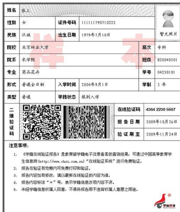
教育部学籍在线验证报告

应须上传“中国高等教育学生信息网”的《教育部学籍在线验证报告》、学生证（注册完整）